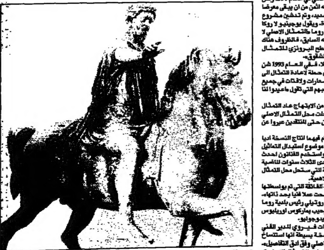
القسمة الجديدة من تمثال ماركوس اوريليوس